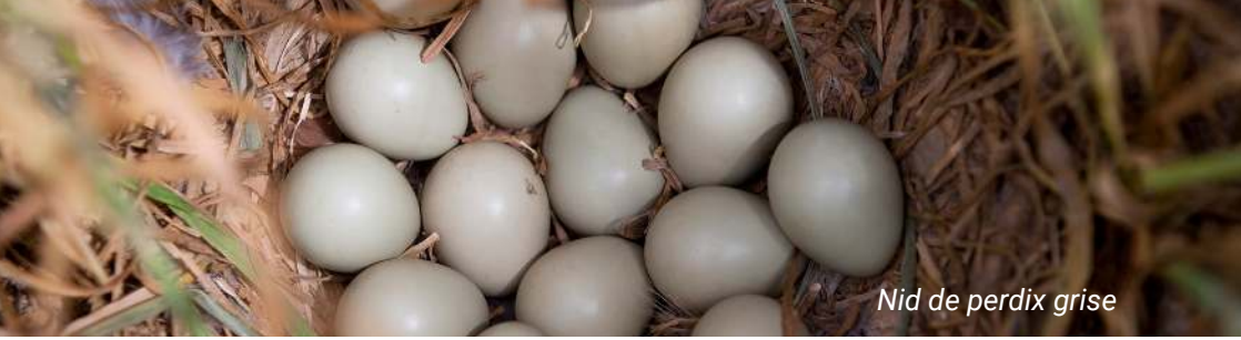
Nid de perdrix grise