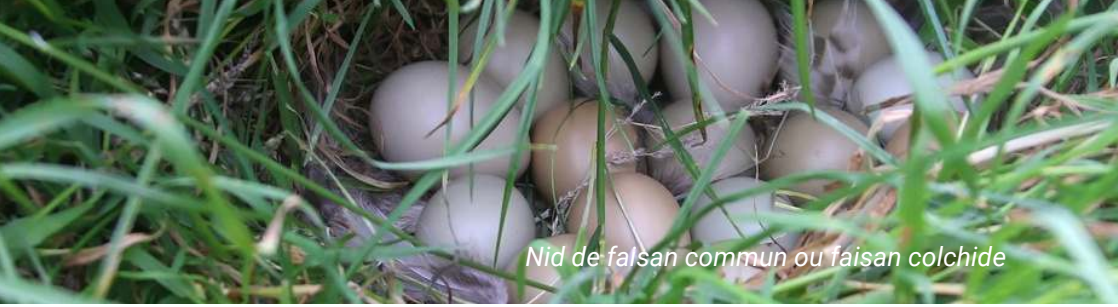
Nid de faisan commun ou faisan colchide